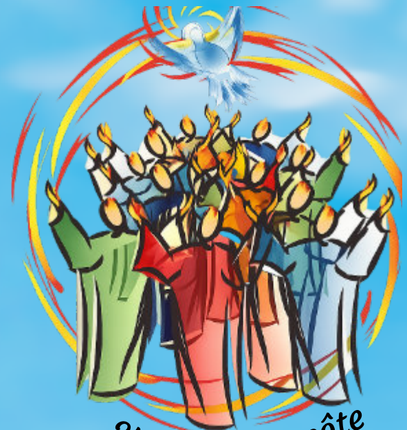
24 mai Pentecôte

Mai, c'est le mois de Marie, c'est le mois le plus beau... Mais, aussi grâce à ses 2 grandes fêtes qui illuminent ce mois de Mai Lieux et horaires des chapelets dans nos trois communautés de paroisses voir page 7