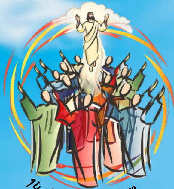
14 Mai Ascension